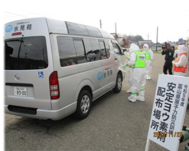
安定ヨウ素剤を受け取り、車両検査会場へ移動し、検査・拭き取り除染を行います