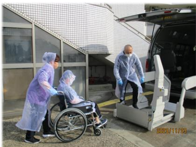
乗車し、一時集合場所の海峰小学校へ向かいます