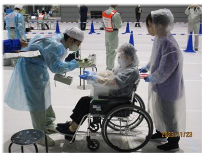
住民検査会場で検査を受け、簡易除染をして除染後確認検査を受けます