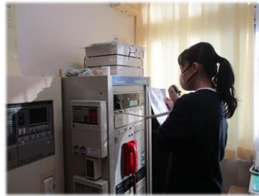
全館緊急放送にて屋内避難指示を発令

11月23日（木）、石川県の志賀町で震度6強の地震が発生し、志賀原発2号機から放射性物質が外部に放出された事態を想定した原子力防災訓練が行われました。屋内退避訓練、一時移転訓練等、緊張感をもって取り組みました。