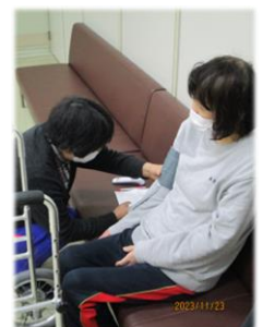
一時移転先の雨晴苑へ移動 バイタルチェックし、移転完了