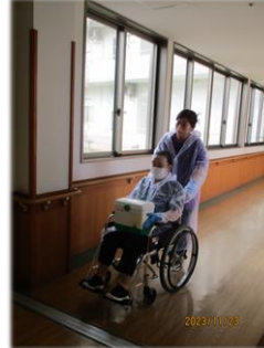
1階氷見苑玄関まで誘導