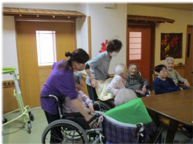
窓から離れた安全な場所へ避難