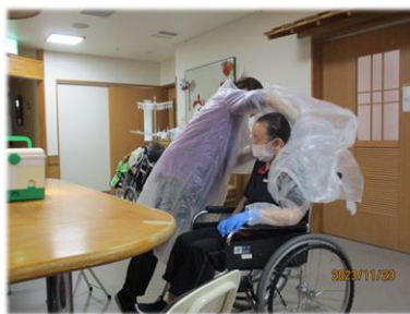
ビニールガッパ、マスク、手袋を装着