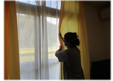
窓を閉鎖、カーテンを閉めます