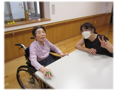
パネル越しとは違い、表情や声が良くわかります。