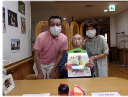
この日は父の日でした。プレゼントを手に、ハイ！チーズ📷

アクリルパネル越しではなく、直接触れ合えるようになり、入居者様・ご家族の皆様大変喜んでいただいております。