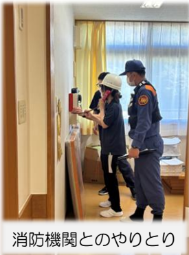
消防機関とのやりとり

今回は4階から出火したとの想定で行いました。初期消火、消防機関への通報、入居者・利用者の皆さんの避難誘導など、慌てず速やかに行動することを心がけました。