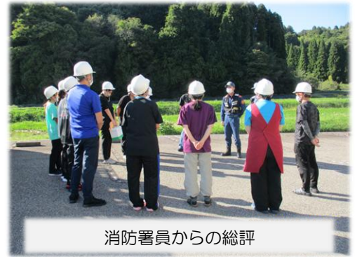
消防署員からの総評