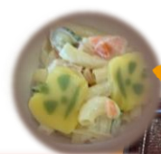
ジャック・オー・ランタンを型取った薄餅入りのマカロニサラダ