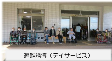
避難誘導（デイサービス）