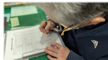
入居者・利用者・職員の安否 確認の連絡を受ける本部長