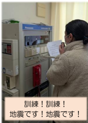
訓練！訓練！ 地震です！地震です！

「訓練、訓練、地震です、地震です。ただいま大きな横揺れが続いています。」のアナウンスで訓練が始まりました。入居者・利用者の皆様を不安にさせないよう声掛けをすることや、身の安全の確保、揺れが収まってからの行動、災害本部の設置、情報収集や安否確認など再確認しました。いつ起こるかわからない地震。いつ起きても迅速かつ冷静に対応ができるよう、災害の備えを継続して心掛けていきたいと思えます。