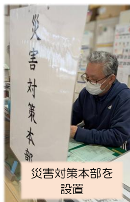
災害対策本部を 設置