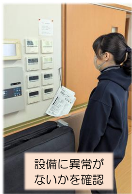
設備に異常がないかを確認